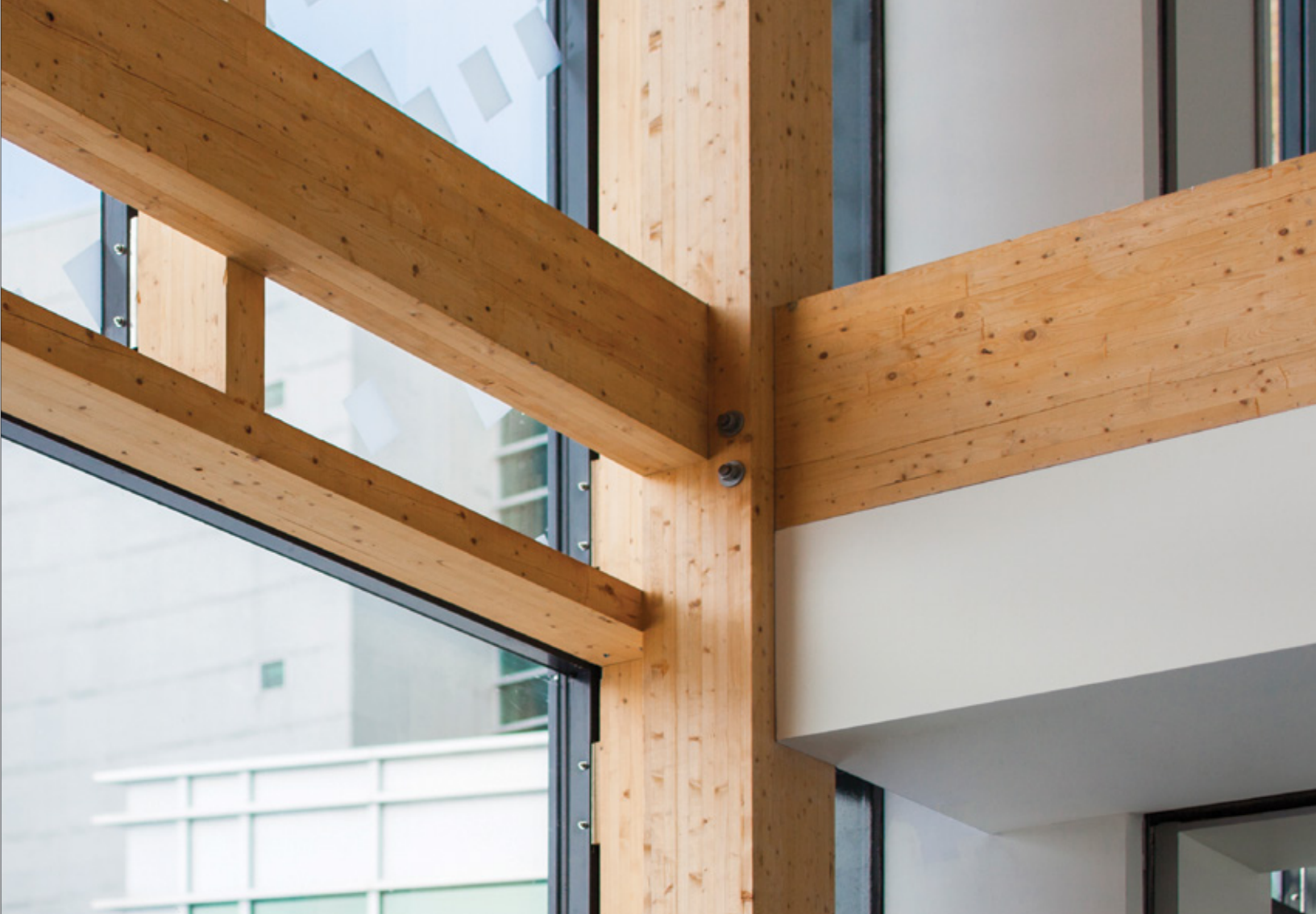
→ Fig. 4: Détail d'assemblage et intégration du mur-rideau à la charpente en bois Assembly detail and integration of the curtain wall to the wood structure

permet d'apprécier la structure en bois de l'édifice, tout en mettant en premier plan le paysage nordique.