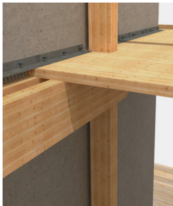
↑ Fig. 2: Détail de connexion de la structure de bois au mur de refend en béton Connection detail between the wood structure and the concrete shearwall